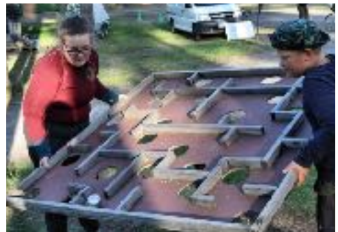
Metsähotellissa oli monenlaisia oheistoimintaa.