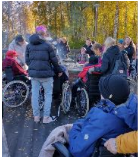
Ikäihmisten ulkoilupäivä Hiekanpäässä.

Vielä vuoden lopuksi meitä voi tulla tapaamaan nuotion äärelle Pieksämäen kauppatorilla uudenvuoden koko perheen tapahtumassa.