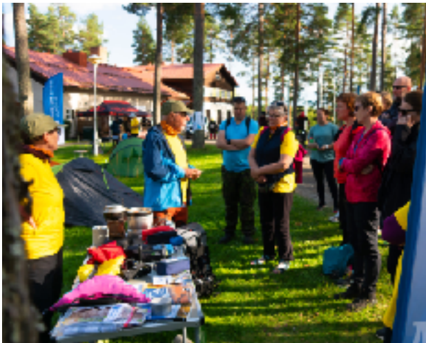
Alueella oli monia retkeilyyn liittyviä neuvontapisteitä.