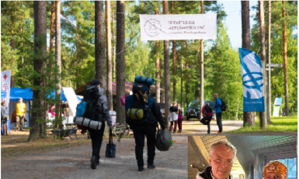
Tervetuloa Metsähotelliin, kaikki valmiina vieraille.